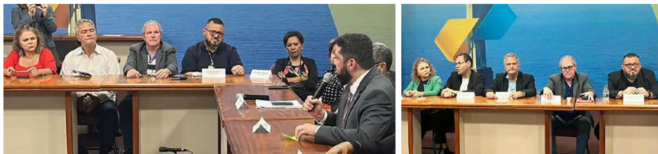
Foto dos Presidentes dos Sindicatos filiados à FINDECT, durante as reuniões da Negociação Coletiva 2023/2024