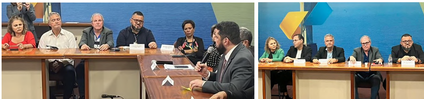
Foto dos Presidentes dos Sindicatos filiados à FINDECT, durante as reuniões da Negociações Coletivas 2023/2024